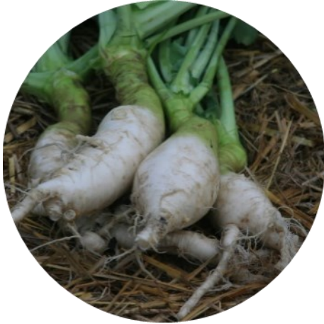
Mille variétés anciennes

Également appelé rutabaga d'Aubigny, ce chou-navet est très réputé en Orléanais. Il est excellent frit à la poêle, mais il peut aussi être utilisé dans les potages, en macédoine ou en accompagnement de viandes.